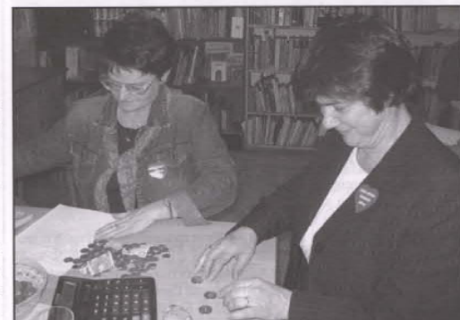
Mamy, mamy... Pełna kasa zawsze cieszy oko!