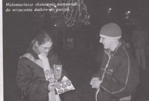
Wolontariusze skutecznie namawiali do wrzucania datków do puszek.

W tym roku, 11 stycznia, po raz 12 zagrała Wielka Orkiestra Świątecznej Pomocy. Podczas niedzielnego Finału zbierano pieniądze na zakup sprzętu medycznego dla ratowania życia niemowląt i dzieci młodszych.