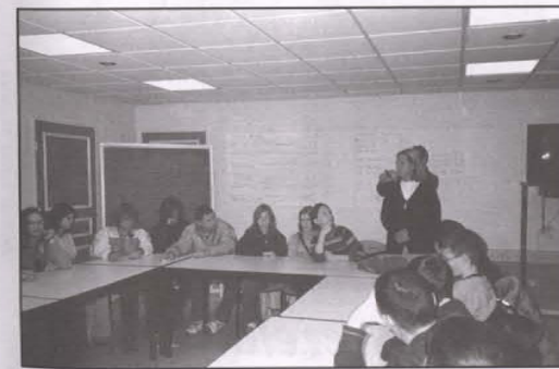
Podczas zajęć w College'u Victora Hugo.

Ważnym dla nas punktem pobytu była wizyta w College'u Victora Hugo. Zobaczyliśmy klasy, pracownie i wzięliśmy udział w zajęciach integracyjnych i w lekcyjach z informatyki. Chociaż wielu nie sprawiło kłopotu komunikowanie się z francuskimi