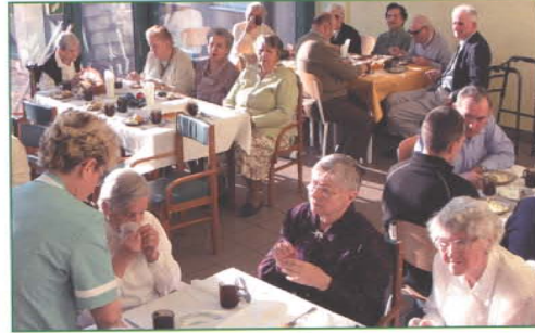
Na wigilijnym stole nie zabrakło tradycyjnych potraw.