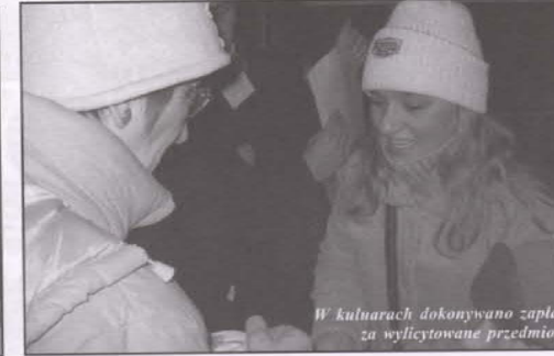
W kuluarach dokonywano zapłaty za wylicytowane przedmioty.