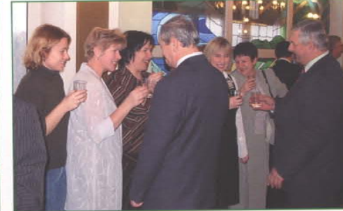
Na koniec roku pracownicy Urzędu Miasta życzyli sobie dobrego Nowego Roku.