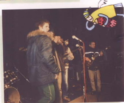
Konopians zaproponowali rytmy ska i reggae, co bardzo przypadło do gustu publiczności