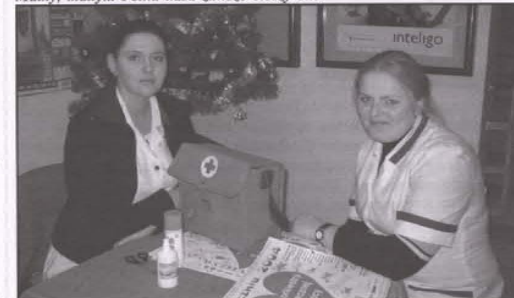
Pierwsza pomoc w pogotowiu