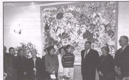
Powitanie w Merostwie w Aubuy.

wetki, żabie udka i małże... Dla niektórych była to pierwsza okazja do spróbowania tych niecodziennych rarytasów. Poznaliśmy więc wielką gościnność francuskiej Polonii.