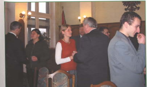
Pierwsze opłatkowe spotkanie Młodzieżowej Rady Miasta z zaproszonymi gośćmi.