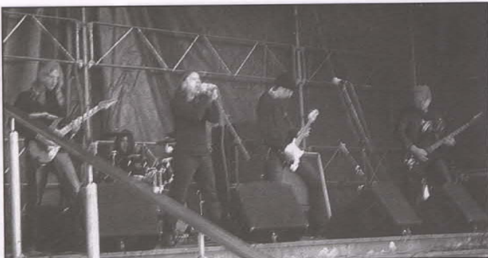
Metal Invaders rozpoczął koncert mocnym brzmieniem

◀ Rozbawiona, roztańczona piosenkami De Mono widownia równie żywo zareagowała na występ znanego czeladzkiego zespołu Konopians , który zagrał nam do godziny 20.00. Kiedy wybrzmiewały jeszcze ostatnie akordy mu-