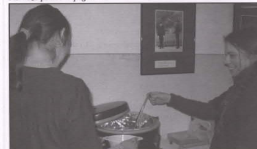
Harcerki z ZHR-u znakomicie sprawdziły się w kuchni