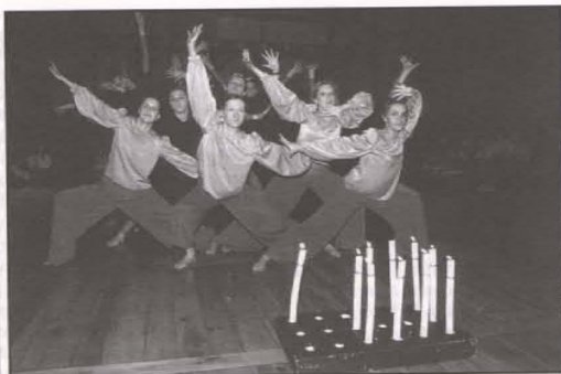
Tańczą Misz Masz.

W pierwszych dniach listopada minionego roku czeladzki zespół taneczny Misz