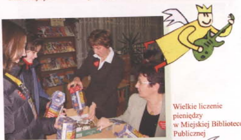
Wielkie liczenie pieniędzy w Miejskiej Bibliotece Publicznej