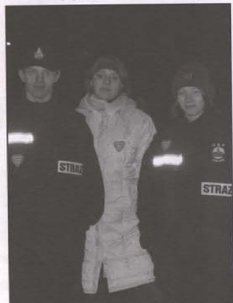
Tego dnia na służbie pojawili się najmłodszy strażacy czeladzkiej OSP - na szczęście oprócz „Świąteczka do nieba” nie mieli więcej roboty.

◀ Rozbawiona, roztańczona piosenkami De Mono widownia równie żywo zareagowała na występ znanego czeladzkiego zespołu Konopians , który zagrał nam do godziny 20.00. Kiedy wybrzmiewały jeszcze ostatnie akordy mu-