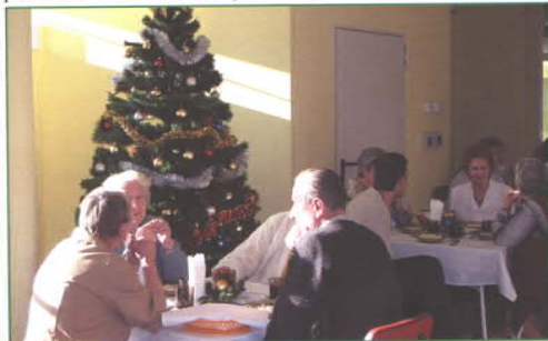
Seniorzy sami przyozdobili świąteczną choinkę.