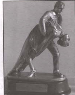
Statuetka - nagroda Radia Rzeszów.