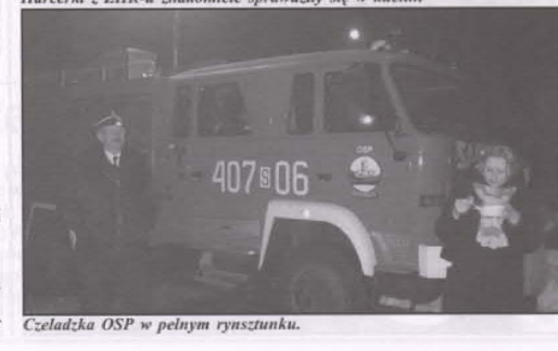
Czeladzka OSP w pełnym rynsztunku.