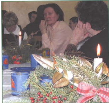
Członkowie Stowarzyszenia Pomocy Osobom z Upośledzeniem Psychicznym i Psychoruchowym też mieli swoją wieczerną wigilijną.