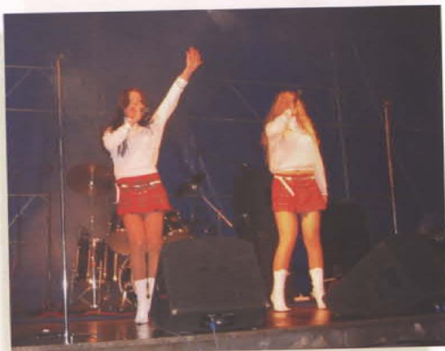
Dziewczyny z Tatuash'u śpiewając znane przeboje, rozgrzały widownię