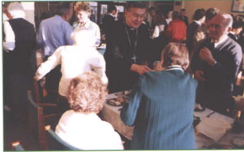
Najczęściej składano sobie życzenia dobrego zdrowia i pogody ducha...