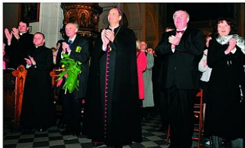
Publiczność a i sam kompozytor długo oklaskiwała śląskich filharmoników.