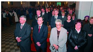
Wśród uczestników uroczystej Mszy Świętej przedstawiciele Senatu RP, prezydenci i burmistrzowie miast zagłębiowskich, władze miasta Czeladź, radni Rady Miejskiej w Czeladzi.