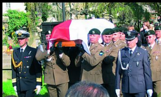
Kraków, 25 kwietnia. Kandykt żałobny zmierzający na cmentarz Rakowicki, gdzie został pochowany gen. Włodzimierz Potasiński.