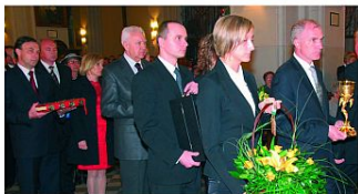
Kielich mszalny ofiarowała firma SKOK.Jawisz z Czeladzi.