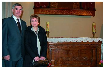
„Ostatnia Wieczerza” – płaskorzeźba w drewnie, dar państwa hwny i Zbigniewa Szaleńców – wypełnia front ołtarza Matki Bożej Częstochowskiej