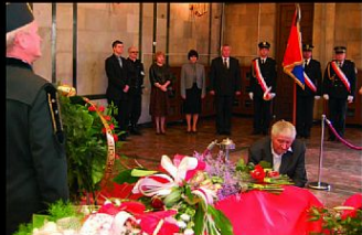
Kaplica na cmentarzu komunalnym w Katowicach. Hołd tragicznie zmarłym senator Krystynie Bochensek i posłowi Grzegorzowi Dolniakowi oddały władze miasta Czeladź.