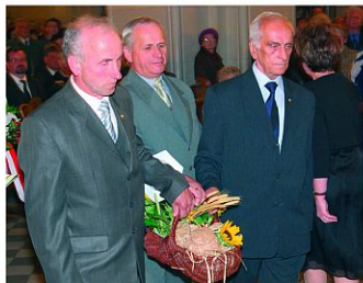
Delegacja Zagłębiowskiego Koła Pszczelarzy w procesji z darami – ofiarowali miód z własnych pasiek.

Wieczorem 8 maja bryła kościoła ukazała się w pełnej krasie.