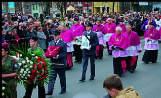
Biedźzin, 22 kwietnia. Kandykt żałobny legnójczygo posła Grzegorza Dolniaka. Został pochowany na cmentarzu parafialnym kościoła św. Trójcy.