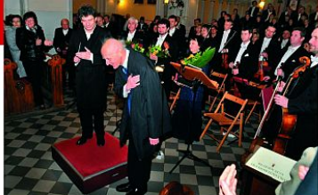
Maestro Wojciech Kilar zaszczylił swą obecnością jubileuszowy koncert.