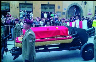
Kraków, 18 kwietnia. Msza żałobna w intencji prezydenta RP Lecha Kaczyńskiego i jego żony Marii odbyła się w kościele Mariackim. Spoczął w sarkofagu na Wawelu. Na zdjęciu Kandykt żałobny.

Władze Miasta Czeladź, uczestnicząc w ceremoniach pogrzebowych, oddały hołd ofiarom katastrofy lotniczej, która wydarzyła się 10 kwietnia pod Smoleńskiem.