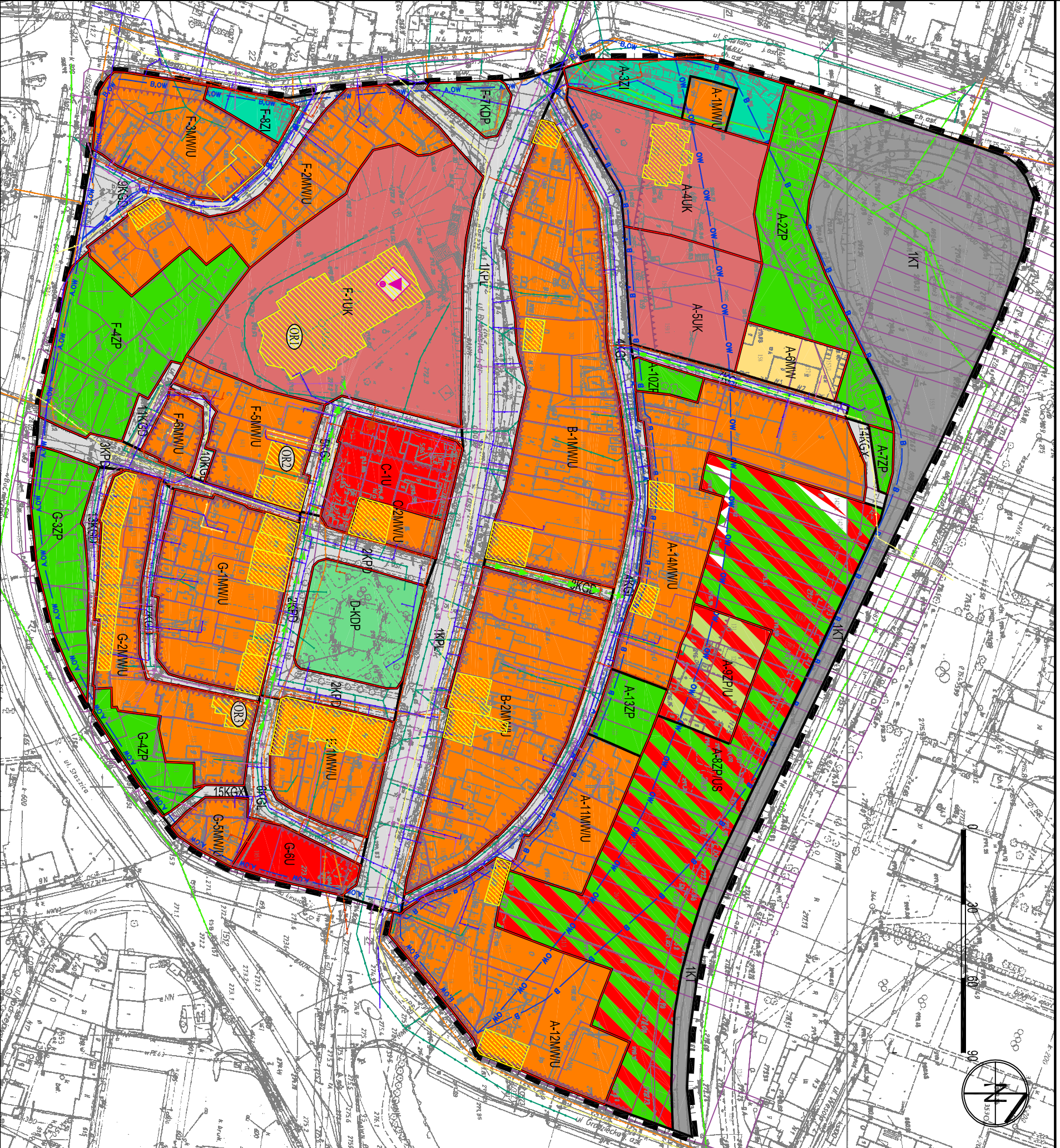
WYRS Z STUDIUM UWARUNKOWAŃ I KIERUNKÓW ZAGOSPODAROWANIA PRZESTRZENNEGO MIASTA CZELADŹ